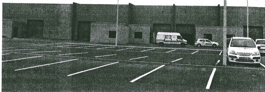
Cinq ateliers allant de 94 à 250 m 2 sont disponibles.

La pépinière d'entreprises de la communauté d'agglomération de Saint-Omer (CASO) est opérationnelle. Investissement public conséquent au cœur d'une grande zone d'activité, elle revendique un rôle dans le dynamisme du territoire. Pour l'illustrer, elle organise un concours d'entreprises.