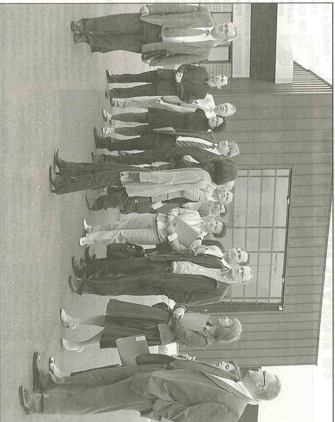
Elus et acteurs locaux se concertent régulièrement pour faire basculer le territoire de la mono industrie à la diversification des activités.

Ces chiffres montrent que tous les outils réunis sur le